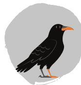
Eigenschaften des Raben: