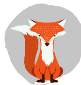
Eigenschaften des Fuchses: